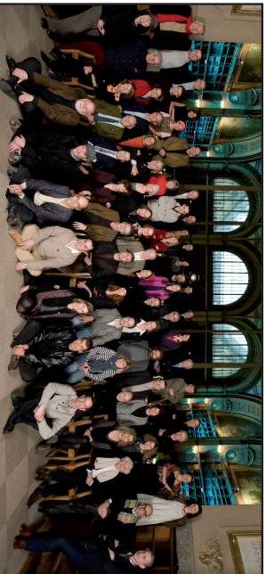
Photo des écrivains à la BNF Richelieu à l'occasion des 10 ans de Lire et faire lire (2010)